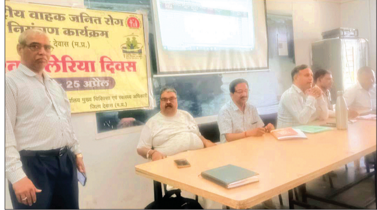
होती है, जबकि मलेरिया में ठंड लगकर बुखार आना प्रमुख लक्षण है। कार्यक्रम में बागली